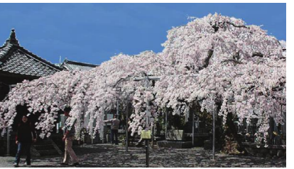
大福寺「徳本桜」 19世紀初めに高名な浄土宗の僧・徳本上人が寺に立ち寄り、講が結成された記念に植えられたなどの説があり「徳本桜」の名で親しまれる。樹齢200年以上とされ、境内で見事な枝ぶりを広げます。