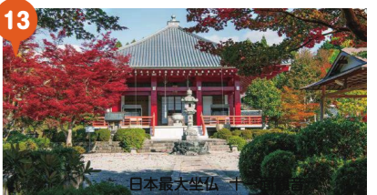
13 いちいの観音 櫛野寺 櫛野寺は、延暦11年(792)に比叡山の開祖伝教大師が櫻の生樹に一刀三礼のもと刻まれたのが、本尊の日本最大坐仏十一面観音菩薩と伝えられます。