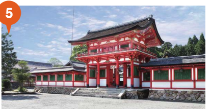
5 甲賀の里の祇園さん 大鳥神社 平安期に起源を持ち祭神は、素戔鳴尊、大己貴命、奇稲田姫。大原祇園祭は7月23日が宵宮祭、翌24日は本祭で花奪いの神事がクライマックスです。